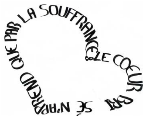
Illustration : Céline (« Le cœur brisé n'apprend que par la souffrance. »)