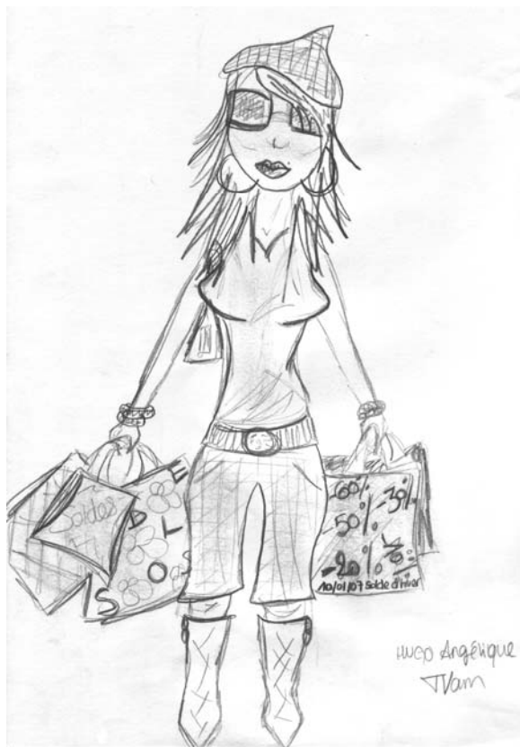
Illustration : Angélique Hugo