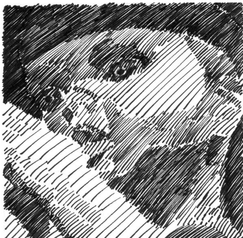
Illustration : Audrey Goepfert

Texte : Sandrine Delcurie et Audrey Goepfert