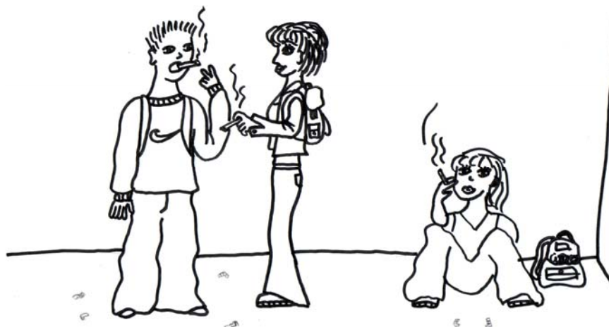
Illustration : Cindy Christnacher