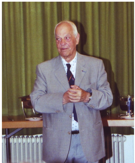
Un homme toujours très engagé.

Le maréchal Pétain avait l'estime des anciens combattants de 14-18... notamment pour la bataille de Verdun en 1916. Ce n'est qu'en 1943 que le revirement s'est produit avec le STO (Service du Travail Obligatoire) qui devait fournir de la main-d'œuvre à l'Allemagne, la création de la milice, les exécutions des résistants, la chasse aux Juifs et les rafles.