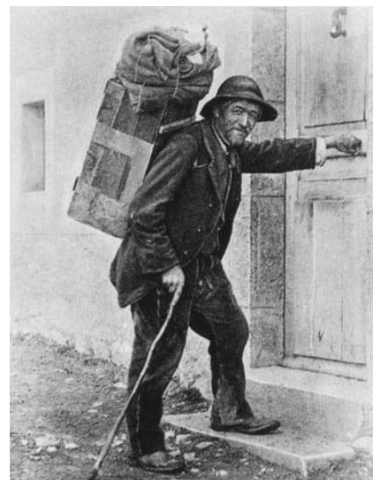
Un colporteur, début du 20 ème siècle.